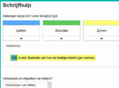
Instellingen voor de Schrijfhulp: wat wil je horen tijdens het typen?